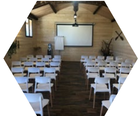
Théâtre 50 personnes