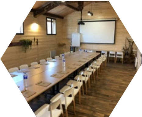
Réunion 25 personnes