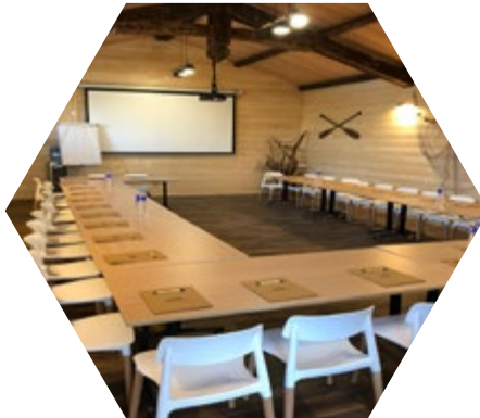
En U 30 - 35 personnes